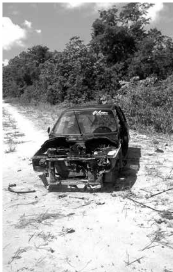
Terreno no Conde pode estar sendo utilizado como ponto para desova de carros roubados

Um desses veículos já foi devolvido ao dono, se-