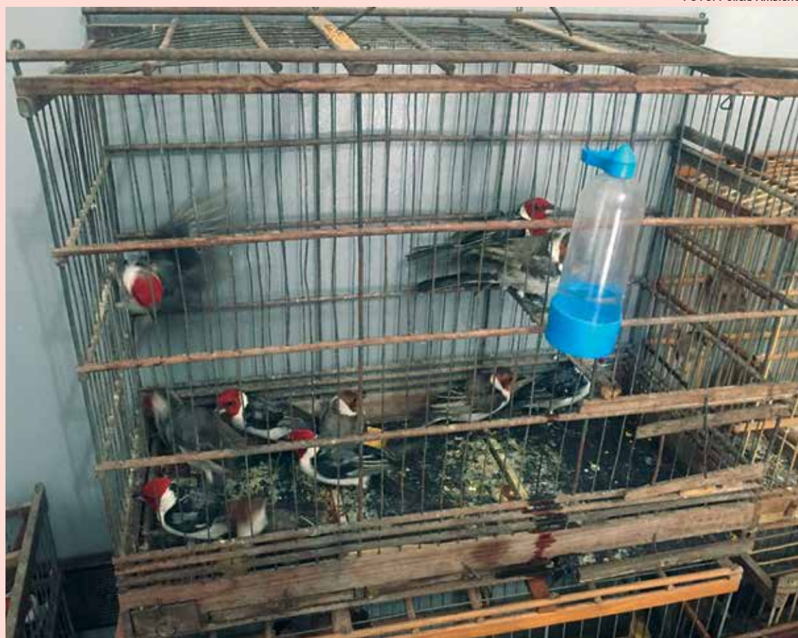
Galo-de-campina é uma das aves mais apreendidas durante as operações realizadas pela Polícia Ambiental

O major da Polícia Ambiental explica que todas as aves silvestres da fauna brasileira são proibidas de comercialização e de manutenção em casa, exceto aquelas que são provenientes de criadouros conservacionistas e devidamente legalizada. Na maioria das ocorrências, as aves são encontradas debilitadas, algumas mantidas em transportadores ou gaiolas pequenas,