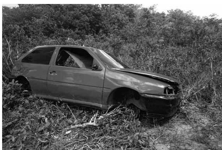
A área onde os veículos foram localizados é pouco movimentada, o que facilita a ação dos bandidos na região do Litoral Sul do Estado

A área onde os carros foram localizados é pouco movimentada. Hector Nunes disse que diligências são realizadas para localizar possíveis veículos abandonados. A polícia acredita que esses carros são 'desovados' após provavelmente serem utilizados em assaltos ou outros tipos de crimes.