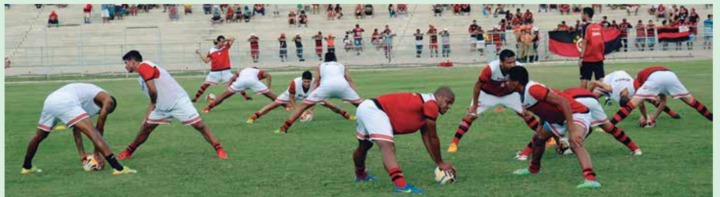
Jogadores do Campinense antes da partida contra o Treze, domingo passado, válida pelo Campeonato Paraibano de 2016