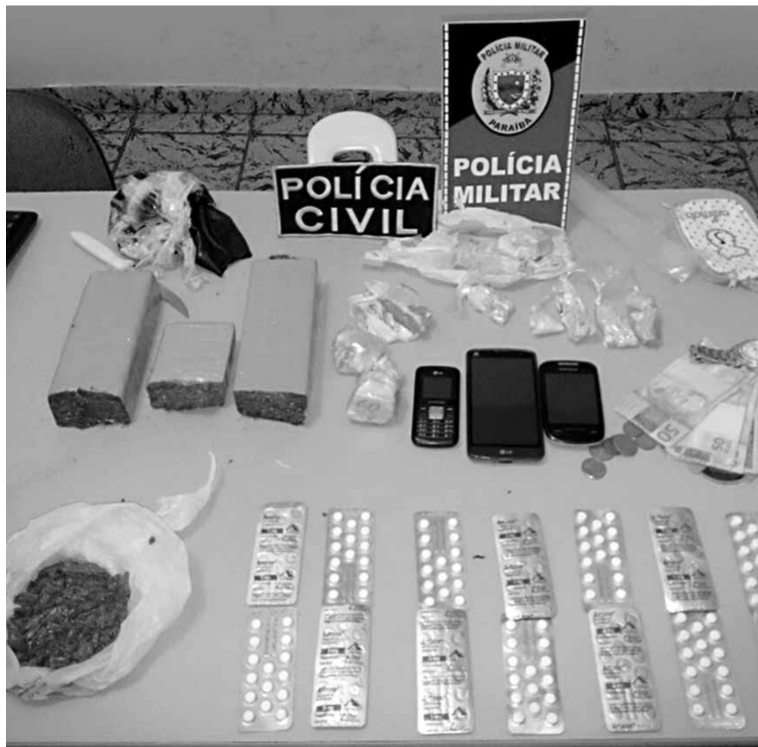
foram apreendidos três tabletes e 65 papelotes de maconha, 147 pedras de crack e 240 comprimidos