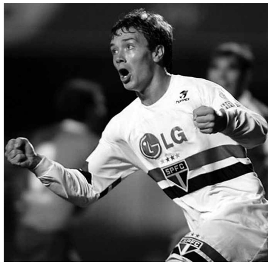
Lugano está entusiasmado para jogar contra o River Plate pela Libertadores

Para essa partida, já foram vendidos mais de 34 mil ingressos, que já é o maior público do São Paulo no ano. O River lidera o Grupo 1 com 8 pontos. O The Strongest tem 7 pontos. O São Paulo é o terceiro colocado da chave, com 5 pontos. Restam duas rodadas.