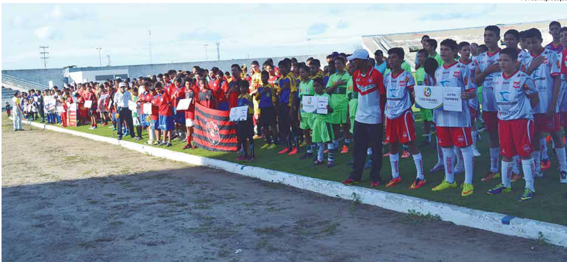
Como nos anos anteriores, o lançamento da Copa Paraíba Sub-15 de Futebol Raimundo Braga será no Estádio Almeidão com o desfile das equipes e a realização de dois jogos

As provas dos percursos de 4 km e 5 milhas, passarão pela Avenida Floriano Peixoto, seguindo direto ao Terminal de Integração, Câmara Municipal, voltando para a Avenida Floriano Peixoto, contornando a rotatória próxima ao Ginásio O Meninão e retornando ao ponto de partida. Os três primeiros colocados de cada percurso serão premiados com troféus e bolsas de estudo de um a seis meses na Academia Korpus.