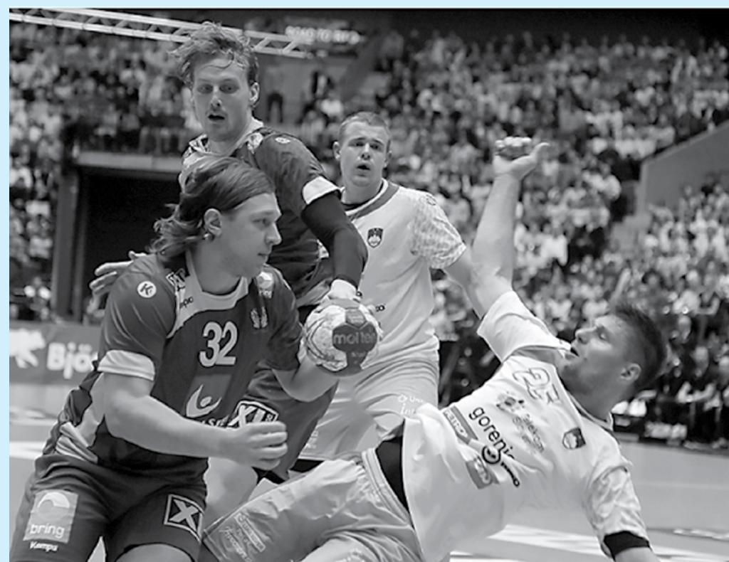
A equipe da Suécia, de camisa escura, está classificada para as disputas das Olimpíadas

A definição dos grupos sai em 29 de abril, na Arena do Futuro, casa do esporte nos Jogos Rio 2016 e no Aquece Rio. Será no primeiro dia do Torneio Internacional Masculino de Handebol, o evento-teste do esporte, que acontece entre os dias 29 de abril e 1º de maio, no Parque Olímpico da Barra.