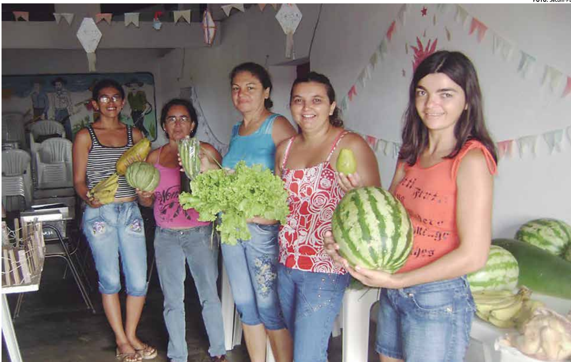
Mulheres são conscientizadas sobre seus direitos com o objetivo de elevar a qualidade de vida e conquistar novos espaços nos mercados de forma sustentável

Ela avalia que nos últimos dez anos, as políticas direcionadas às mulheres têm incentivado a valorização e a visibilidade de seus trabalhos, o que tem